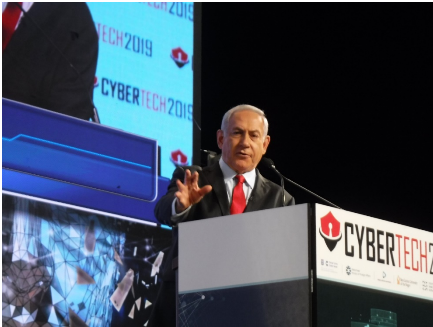
CYBERTECH TLV 2019 でのイスラエル ネタニヤフ首相の基調講演